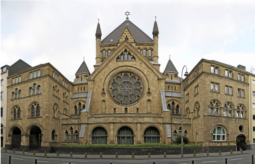
Kölner Synagoge in der Roonstraße (2006).