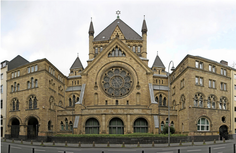
Kölner Synagoge in der Roonstraße (2006).