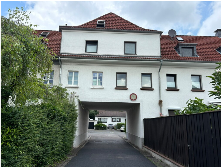
Torbogenhaus der Siedlung am Klausenberg (2024)