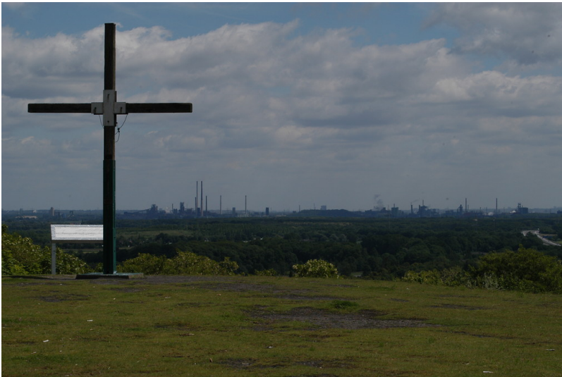
Die Halde Pattberg in Moers - Blick über das Umland (2006)