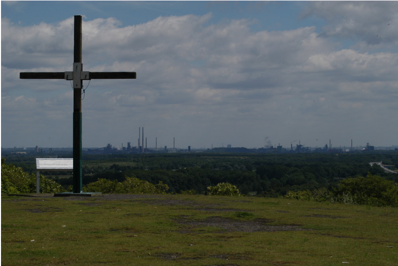
Die Halde Pattberg in Moers - Blick über das Umland (2006)