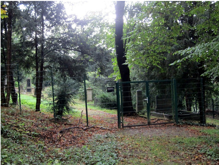
Jüdischer Friedhof am Pastoratsberg in Werden (2011)