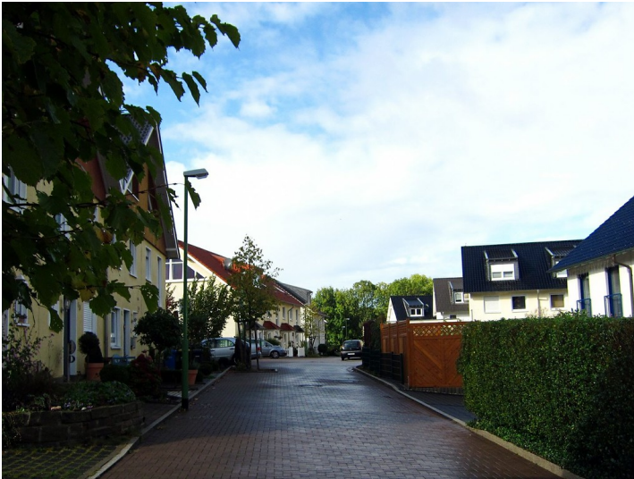
Heute modern überbauter Standort des ehemaligen Jüdischen Friedhofs "Am Knottenberg" in Essen-Steele (2011)