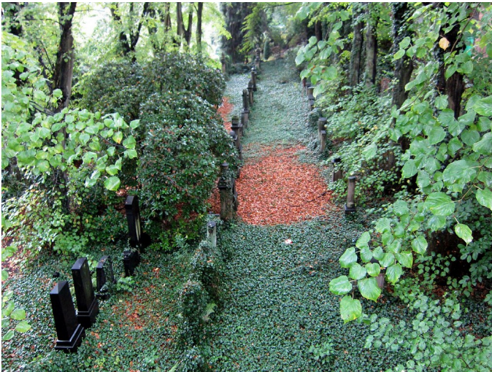
Jüdischer Friedhof Hiltrops Kamp in Essen-Steele (2011).