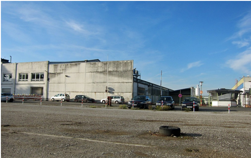
Firmengelände der Girmes-Werke AG in Grefrath-Oedt (2013). Im Bereich des heutigen Firmengeländes lag ursprünglich der jüdische Friedhof von Oedt.