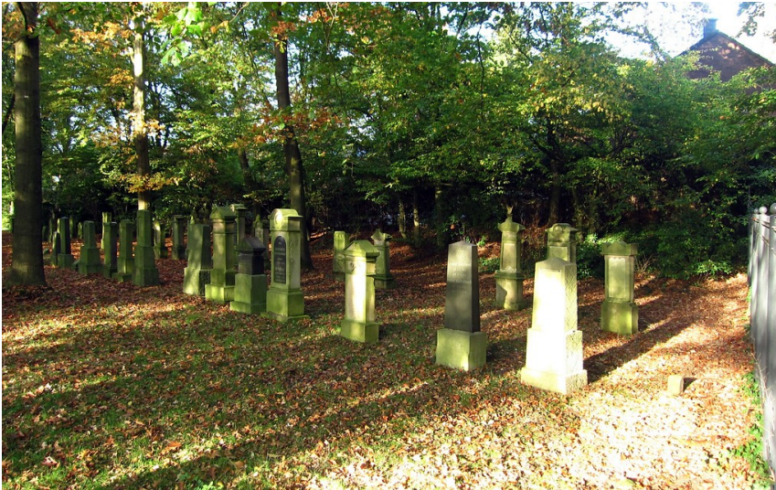
Gräberfeld auf dem Judenfriedhof Kamperlings in Kempen-Oedt (2013)