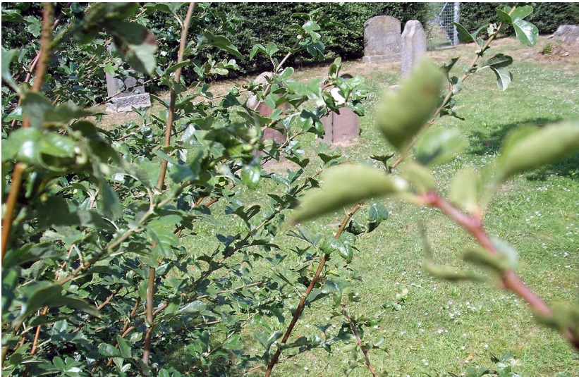
Jüdischer Friedhof Kelz bei Vettweiß (2009)