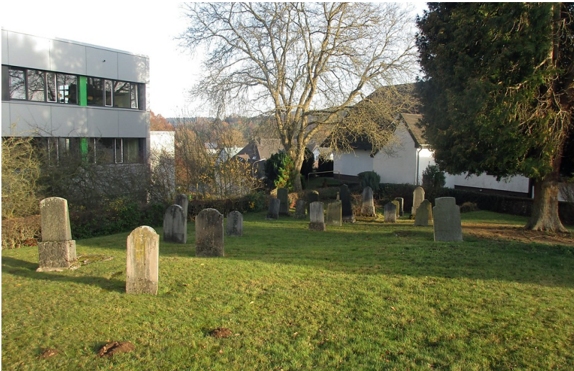
Blick auf den jüdischen Friedhof Loshardt in Kall (2016).