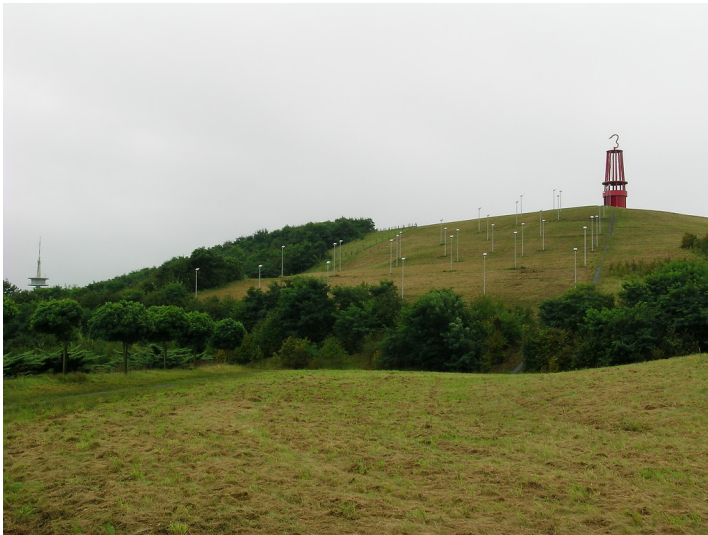
Die Halde Rheinpreußen in Moers mit der Kunstinstallation "Geleucht" (2007)