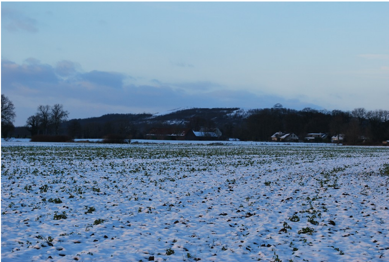
Halde Norddeutschland in Neukirchen-Vluyn (2014)