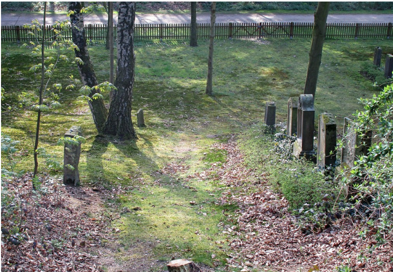
Gräberreihe auf dem nach Nordwesten hin ansteigenden Gelände des jüdischen Friedhofs "Bönninghardter Heide" am Xantener Weg bei Issum (2016).