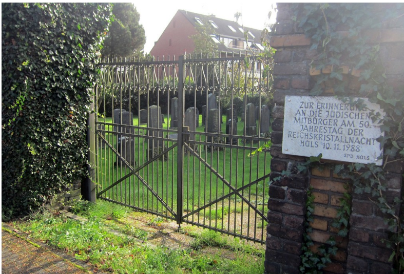
Eingangstor zum jüdischen Friedhof am Strathhof in Krefeld-Hüls. Daneben befindet sich eine Gedenktafel (2014).