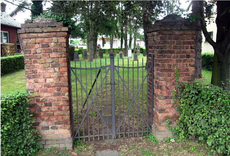
Eingang zum Judenfriedhof in der Elbestraße in Bornheim-Hersel (2013)