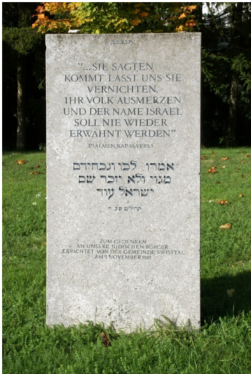
1981 errichteter Gedenkstein auf dem jüdischen Friedhof am Dornbuschweg in Swistal-Heimerzheim (2013).