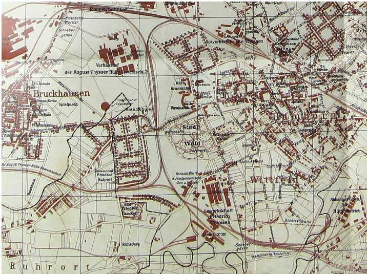
Ausschnitt der Karte "Hamborn am Rhein 1927" (Verlag L. Schwann, Düsseldorf, hier aus dem Rheinischen Städteatlas)