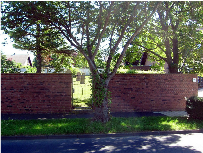
Der Eingangsbereich zum jüdischen Friedhof Alfred-Wegener-Straße in Euskirchen-Großbüllesheim (2012).