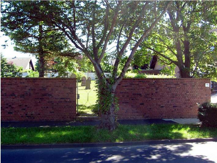
Der Eingangsbereich zum jüdischen Friedhof Alfred-Wegener-Straße in Euskirchen-Großbüllesheim (2012).