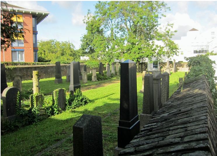
Blick auf den jüdischen Friedhof mit erhaltenen Grabsteinen in der Montanusstraße (2014)