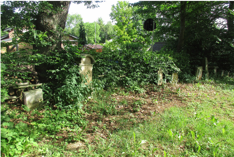
Allmählich zuwucherndes Gräberfeld auf dem jüdischen Friedhof in Hürtgenwald-Gey (2017).