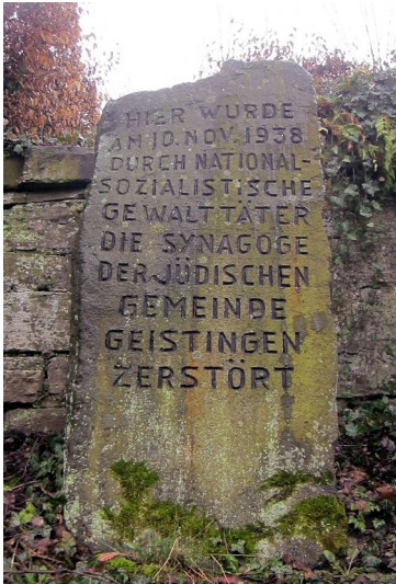
Gedenkstein an der ehemaligen Synagoge Hennef-Geistingen, Söverner Straße (2013)