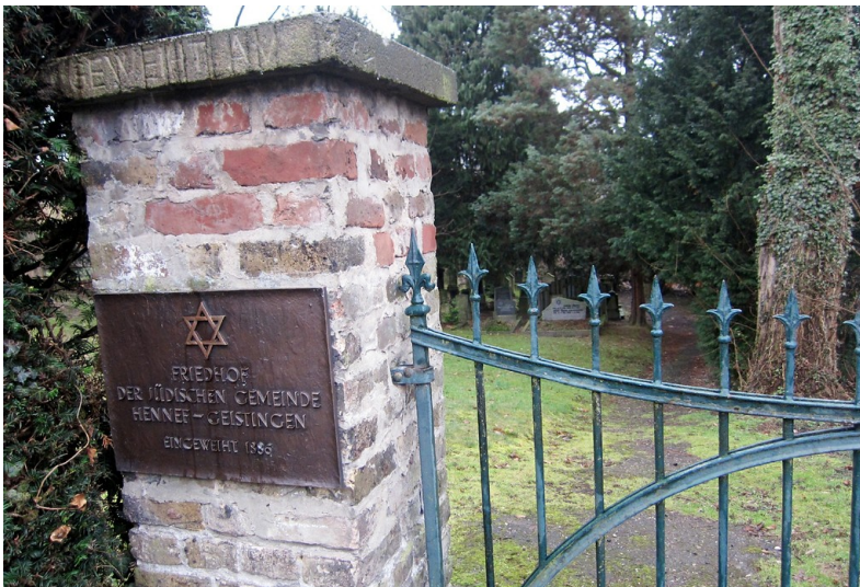
Eingangsbereich des jüdischen Friedhofs in Hennef-Geistingen (2013).