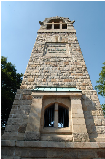
Das Berger-Denkmal auf dem Hohenstein bei Witten (2006)