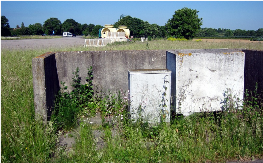
Ein elektrischer Schaltkasten vor einer Abstellfläche des früheren Autobahn-Notlandeplatzes auf der Bundesautobahn A 61 am Meckenheimer Kreuz (2015). Dieses Autobahnstück konnte in kurzer Zeit in einen militärischen Behelfsflugplatz umgewandelt werden.