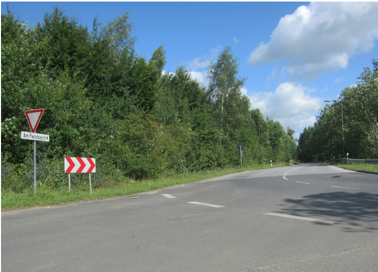
Der Bereich "Am Pielsbusch" zwischen Gustorf-Gindorf und Frimmersdorf bei Grevenbroich, wo sich ehemals ein jüdischer Friedhof befunden hatte (2014).