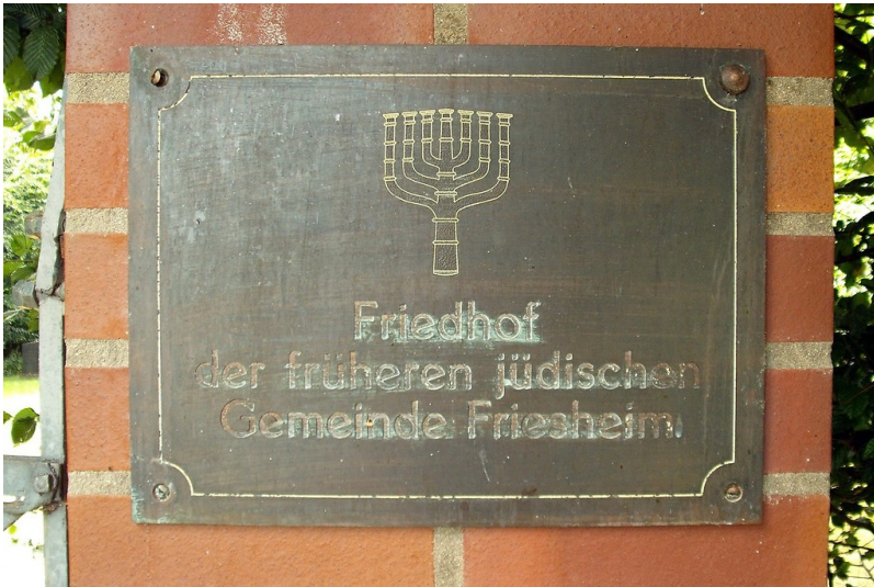
Jüdischer Friedhof Friesheim (2009)

Schlagwörter: Jüdischer Friedhof , Bethaus , Judentum , Synagoge Fachsicht(en): Kulturlandschaftspflege, Denkmalpflege, Landeskunde Gemeinde(n): Erftstadt Kreis(e): Rhein-Erft-Kreis Bundesland: Nordrhein-Westfalen