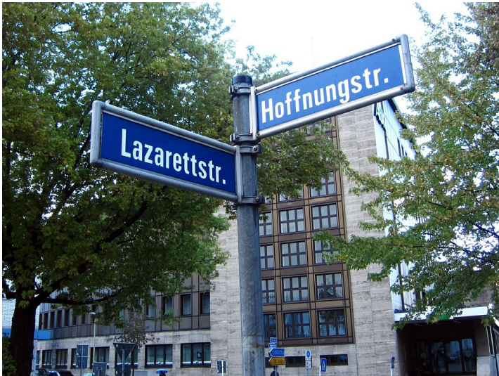
Straßenkreuzung Lazarettstraße / Hoffnungsstraße im Bereich des früheren Standorts des alten Jüdischen Friedhofs in Essen (2011).