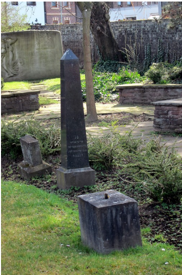
Gedenkstein in Form eines Obeliskens auf dem Jüdischen Friedhof in der Talstraße in Eschweiler (2014)