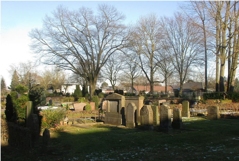
Jüdischer Friedhof "am Hasenberg", Gräberfeld auf dem Kommunalfriedhof in Emmerich (2017).