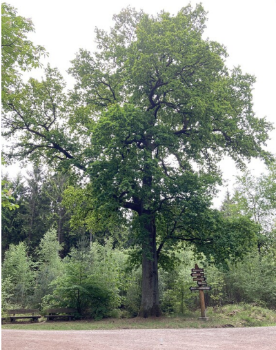
Kaisereiche im Königsforst (2020)