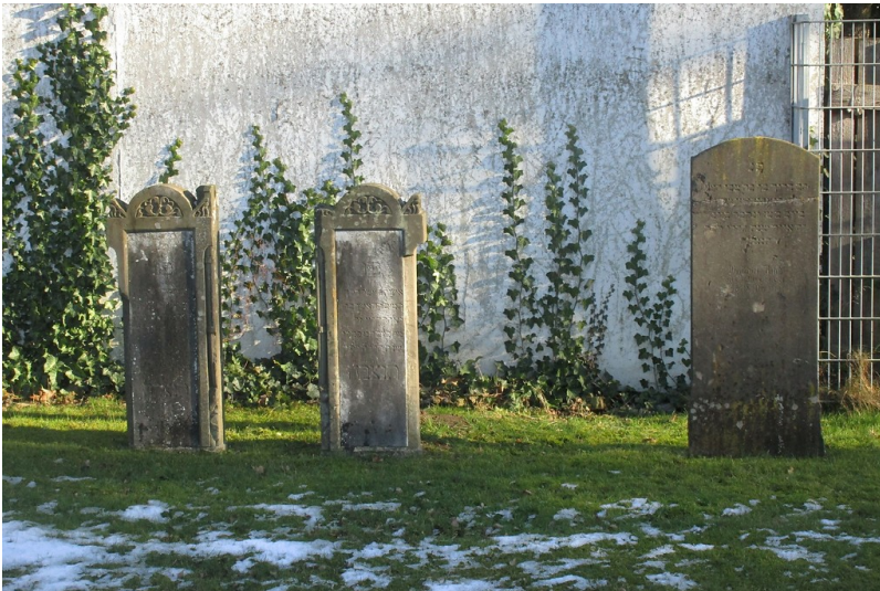
Grabsteine auf dem jüdischen Friedhof in der Wassenbergstraße in Emmerich (2017).