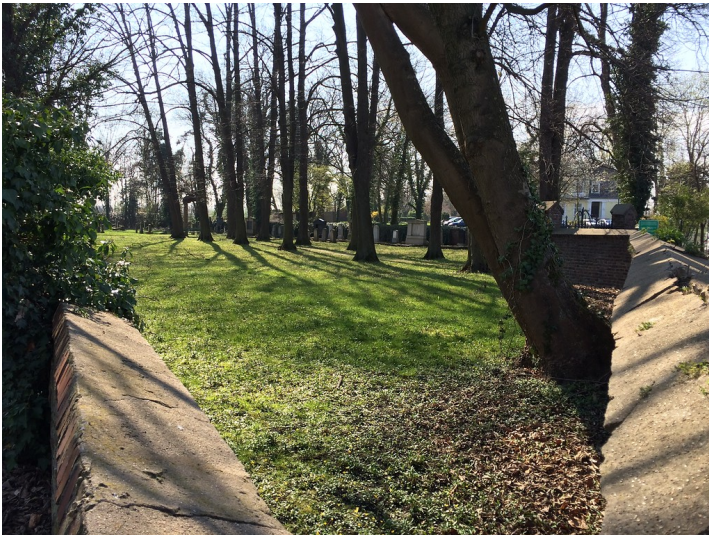
Der jüdische Friedhof in Elsdorf von einer Ecke der Friedhofsmauer aus fotografiert