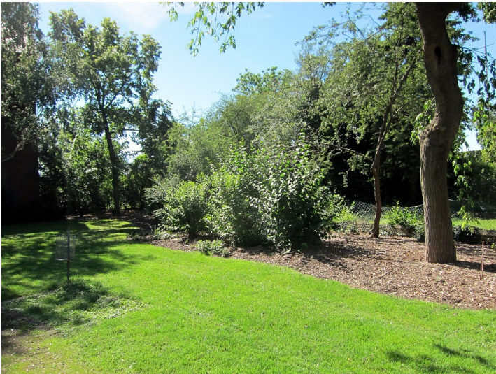
Ehemaliger Standort Jüdischer Friedhof Kölner Straße (Euskirchen)