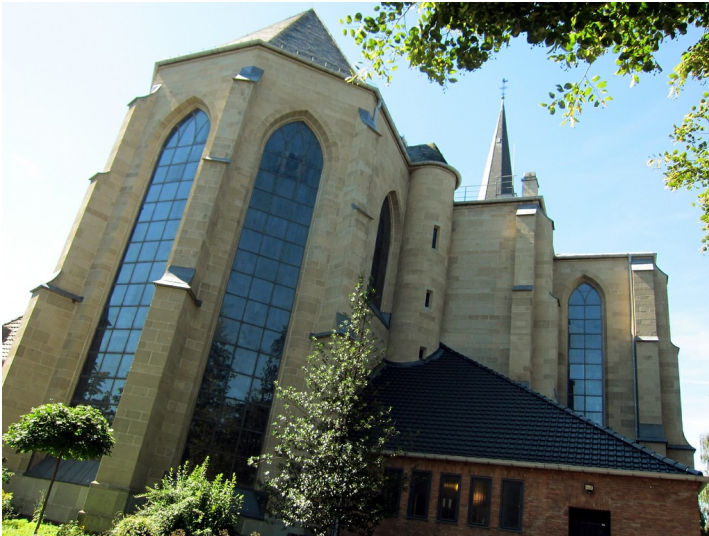
Herz-Jesu-Kirche in Euskirchen (2012)