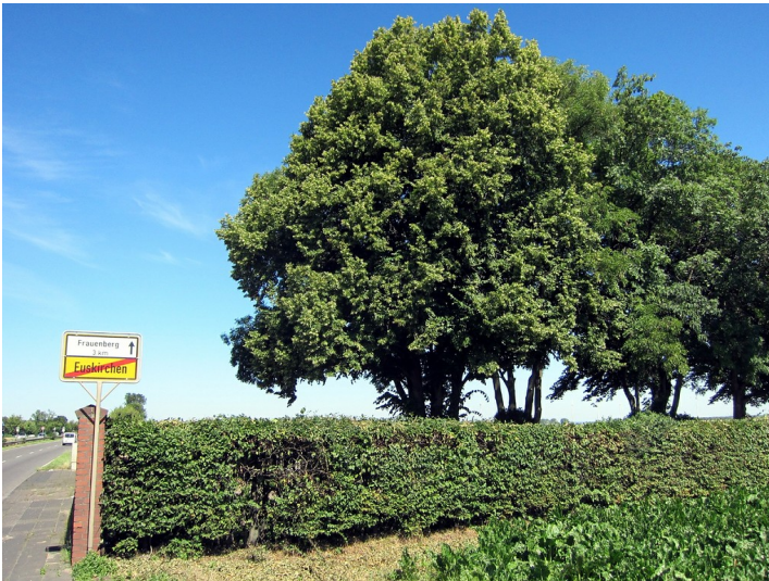
Blick auf den jüdischen Friedhof Frauenberger Straße Euskirchen (Juli 2012).