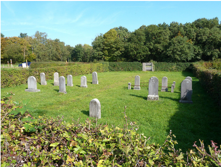
Das Gräberfeld auf dem jüdischen Friedhof in der Von-Coels-Straße in Aachen-Eilendorf (2011)