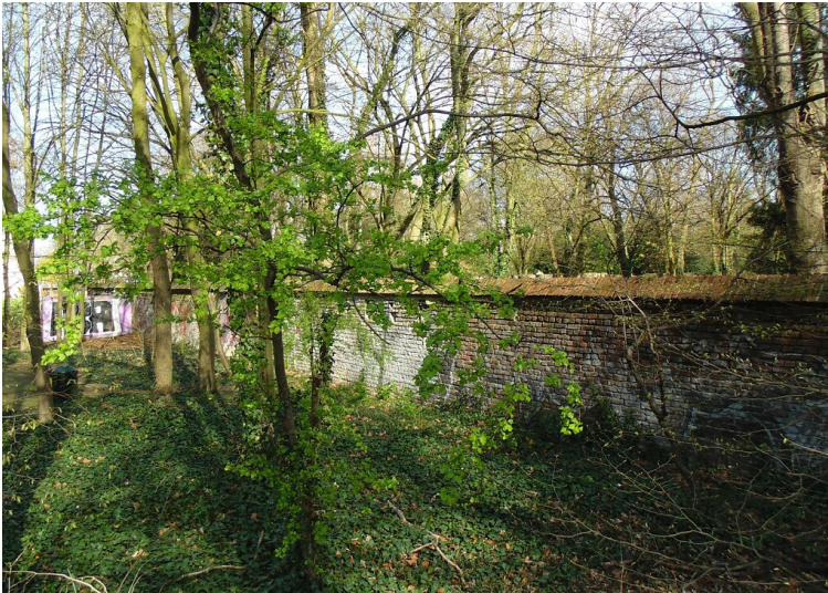
Die umgebende Friedhofsmauer des unmittelbar neben dem Kölner Melatenfriedhof gelegenen jüdischen Friedhofs Ehrenfeld in Köln-Lindenthal (2020).