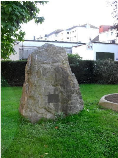
Der Gedenkstein auf dem alten jüdischen Friedhof Arnoldsweiler Straße in Düren (2010).