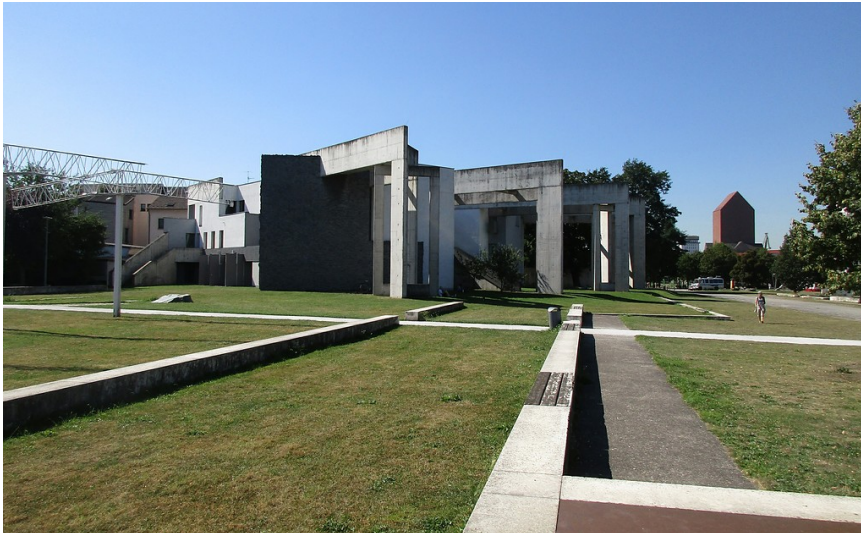
Außenansicht der Neuen Duisburger Synagoge am Innenhafen, vorne im Bild Teile des "Gartens der Erinnerung" und im Hintergrund rechts das Gebäude des Landesarchivs NRW (2016).