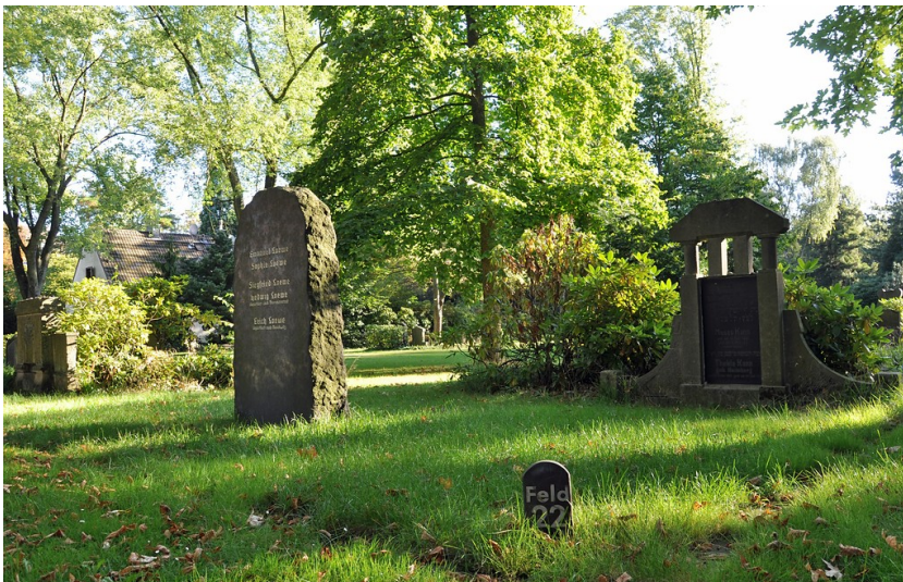
Das Gräberfeld Nummer 22 auf dem jüdischen Friedhof des kommunalen Friedhofs Sternbuschweg (2016).