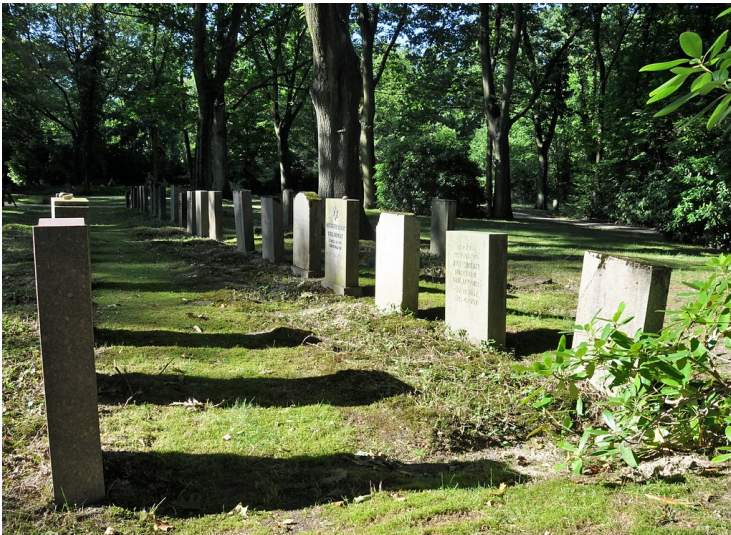
Zwei Gräberreihen auf dem neuen jüdischen Friedhof auf dem Duisburger Waldfriedhof (2016).