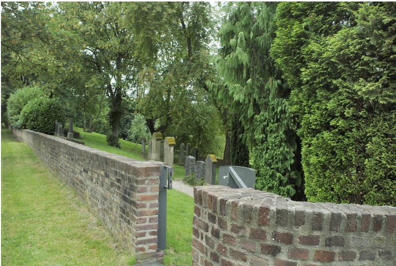
Die Friedhofsmauer des Jüdischen Friedhofs an der Krefelder Straße in Dormagen.