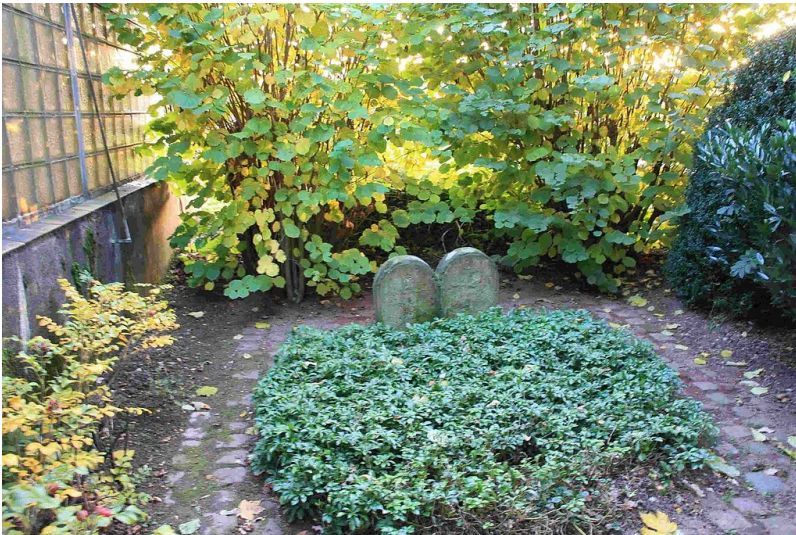
Grabstelle auf dem Jüdischen Friedhof in der Baumstraße in Erftstadt-Dirmerzheim (2010)