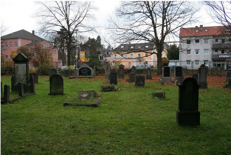
Jüdischer Friedhof in der Schildgesstraße in Brühl (2010)