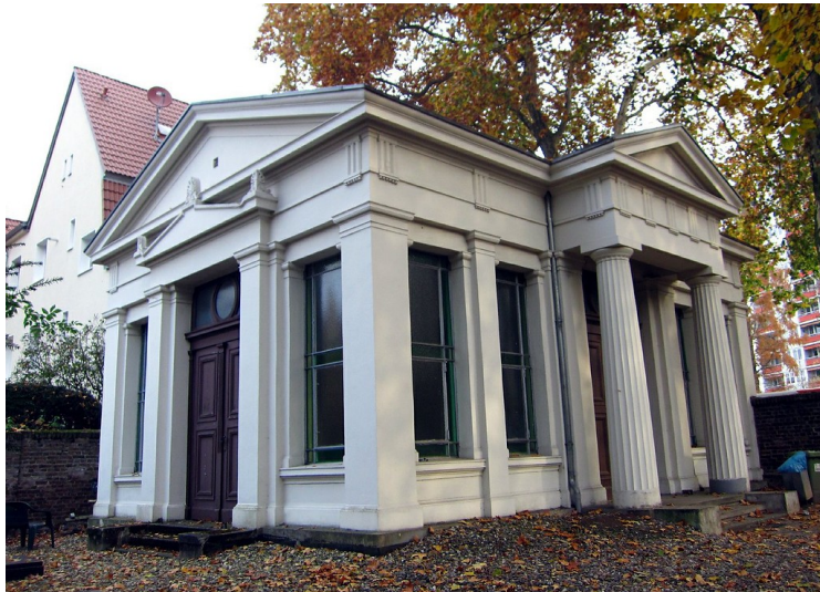
Die Aussegnungshalle am Jüdischen Friedhof am Augustusring in Bonn-Castell (2011).