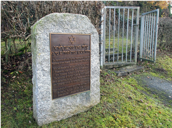
Jüdischer Friedhof am Zengselsberg in Hellenthal-Blumenthal: Gedenkstein und Eingangspforte (2016).