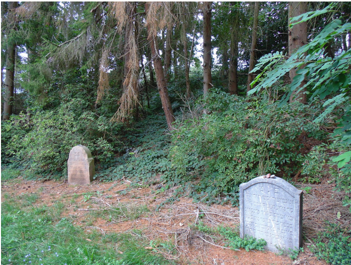
Jüdischer Friedhof Bleibuir, zwei der insgesamt vier erhaltenen Grabstätten vor Ort (2020).