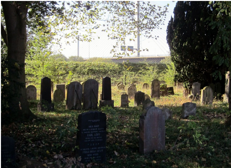
Jüdischer Friedhof in Schwarzhemdorf / Beuel (2011)